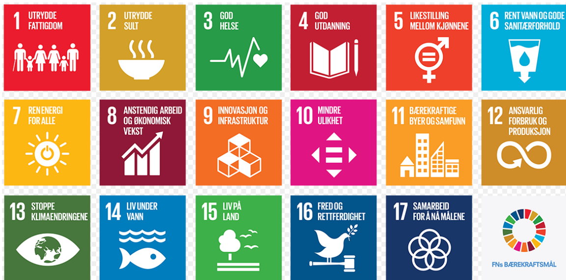
Figur 2: FN's 17 bærekraftsmål

Videre har regjeringen bestemt at FNs 17 bærekraftsmål, som Norge har sluttet seg til, skal være det politiske hovedsporet for å ta tak i vår tids største utfordringer, også i Norge. Det er derfor viktig at bærekraftmålene blir en del av grunnlaget for samfunns- og arealplanleggingen.