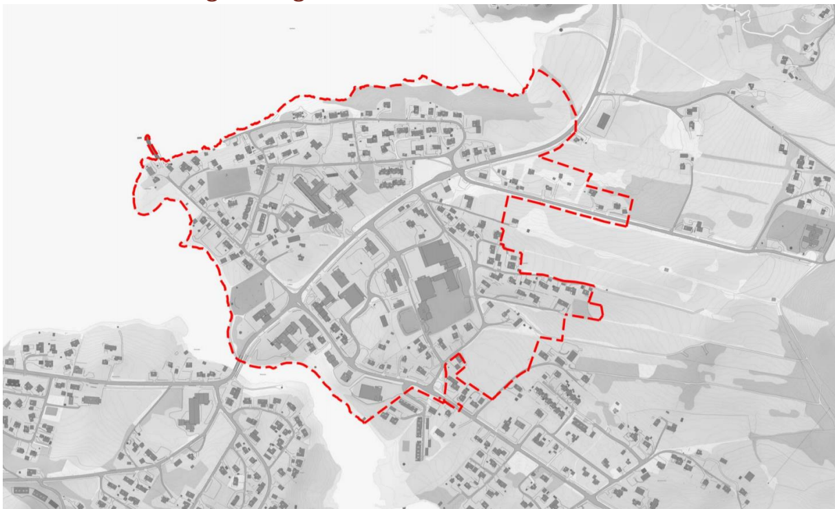
Figur 1: Plangrensen markert i rød stiple linje. Innskrenkinger kan bli aktuelt.