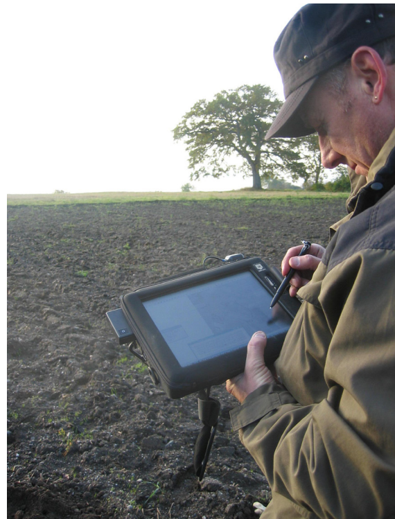
I felt foregår registreringen av jordtyper på en felt-PC med digitale flybilder.

I tillegg til jordtype deles arealene inn på bakgrunn av terrengegenskaper som har vesentlig betydning