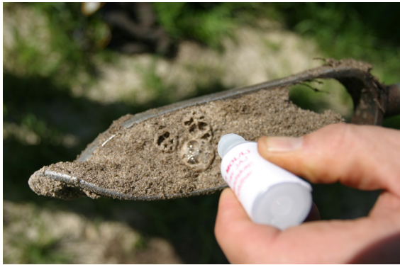
Ved hjelp av saltsyre testes jorda for høyt kalkinnhold.

av en terrengmodell. For områder med tilrettelagte laserdata brukes DTM1x1m basert på laserdata. For de andre områdene brukes Kartverkets DTED 10x10m. Basert på modeller avledes ny informasjon i form av en rekke temakart for ulike formål