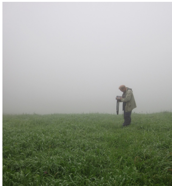
Jordsmonnkartlegging foregår om våren, forsommeren og høsten. Dårlig vær er som regel ingen hindring.

Kartene finner du på www.kilden.nibio.no .