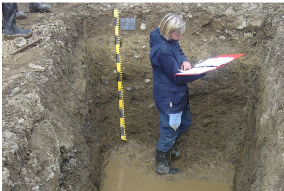
Jordtypene dokumenteres bl.a. ved hjelp av profilbeskrivelser.

av en terrengmodell. For områder med tilrettelagte laserdata brukes DTM1x1m basert på laserdata. For de andre områdene brukes Kartverkets DTED 10x10m. Basert på modeller avledes ny informasjon i form av en rekke temakart for ulike formål