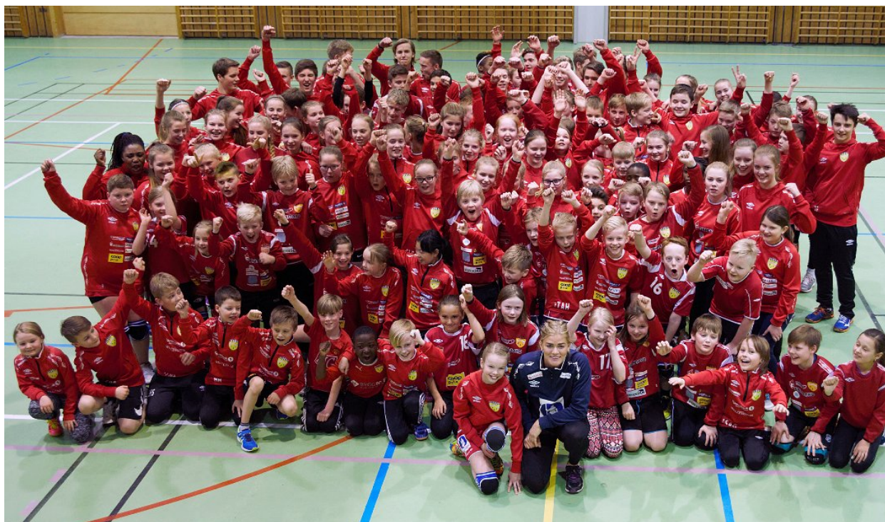
Sørreisa IL

Rapporten poengterer at satsningen må fremgå av kommunestyrets planstrategi og være tydelig i kommuneplanens samfunnsdel. Videre må de enkelte del- og sektorplaner videreføre satsningsområdene til et mer operativt nivå i tjenesteytingen.