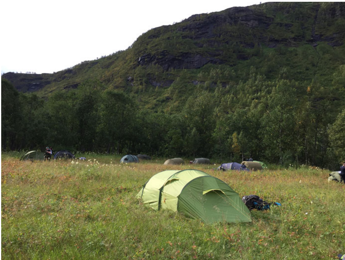
Sørreisa sentralskole på telttur til Steinora 2017

Det er to statlig sikra friluftsområder i Sørreisa. Kamplia karakteriseres som ett «dagstuområde i høyden» og Storneset er et strandområde midt i Sørreisa sentrum. Kamplia ligger mellom Vakkerhumpen 503 moh og Høggkampen 452 moh i Sørreisa kommune, og grenser til Målselv kommune. Området er et utfartsområde for turgåere sommer som vinter, med god tursti og oppkjørt skiløype. Det er fine små fiskevann og myrdrag i området. Godt egnet for bærplukking. Storneset sikrer tilgjengeligheten til strandsonen som ligger nært bebyggelsen. Området benyttes til turgåing og noe bading. Det er ingen form for tilrettelegging i området. I 2011 ble det utarbeidet en forvaltningsplan for disse områdene i samarbeid med Sørreisa kommune. Og i 2016 ble det tilrettelagt med en flott gapahuk i Kamplia med bål plass og godt merka tursti.